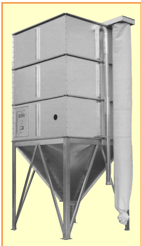
Silo BMI à piètement tubulaire

silos sur trémie 4 pentes trémie à 45° pour grains et granulés - trémie à 60° pour farines capacités de 0,1 à 92 m 3