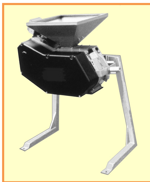
modèle Spécial avec support-potence ( en option )